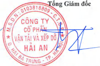
Tạ Mạnh Cường